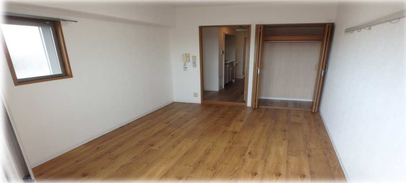
図面と現況が異なる場合、現況有姿とさせていただきます。